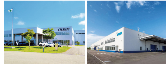
アイシン北海道(株) (株)ダイナックス

苫東地域の丘陵地に位置し、新千歳空港ターミナルから車で20分。自動車関連産業をはじめとする製造業、食関連産業、エネルギー関連産業、物流関連産業、リサイクル関連産業など様々な企業が立地。生産・研究施設等リスク分散の最適地でもあります。