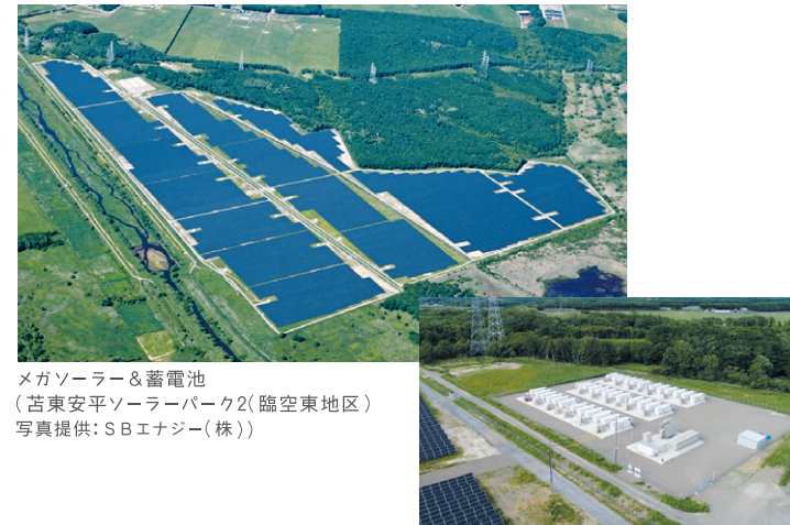
メガソーラー&蓄電池 (苫東安平ソーラーパーク2(臨空東地区))