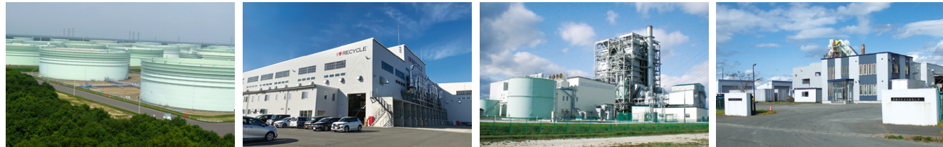
苫東石油備蓄(株) (株)マテック (株)サニックスエナジー 空知興産(株)

大規模な石油備蓄基地が立地しています。また、循環産業拠点構想に基づく基盤整備により、リサイクル関連産業の集積が進んでおり、環境・エネルギー関連産業などに適している地区です。