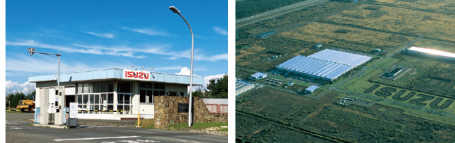
いすゞエンジン製造北海道(株) いすゞエンジン製造北海道(株)

日高自動車道、国道235号線、道道上厚真苫小牧線に囲まれた好適地に、自動車関連産業と研究施設が立地しています。