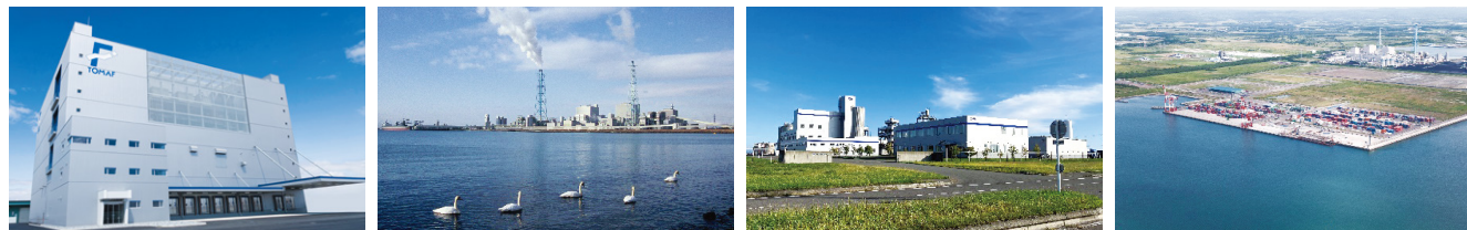
苫小牧埠頭(株) 北海道クールロジスティクスプレイス 北海道電力(株)苫東厚真発電所 オエノングループ 合同酒精(株)苫小牧工場 苫小牧国際コンテナターミナル

大型船(10万tクラス)の入出港が可能な水域と平坦で広大な後背地があり、火力発電所や物流施設などが立地しています。国際コンテナターミナルや国内フェリー航路が開設されているほか、今後、道内最大級の温度管理型冷凍冷蔵倉庫を中心とした食関連産業等の国際物流拠点としても期待されています。