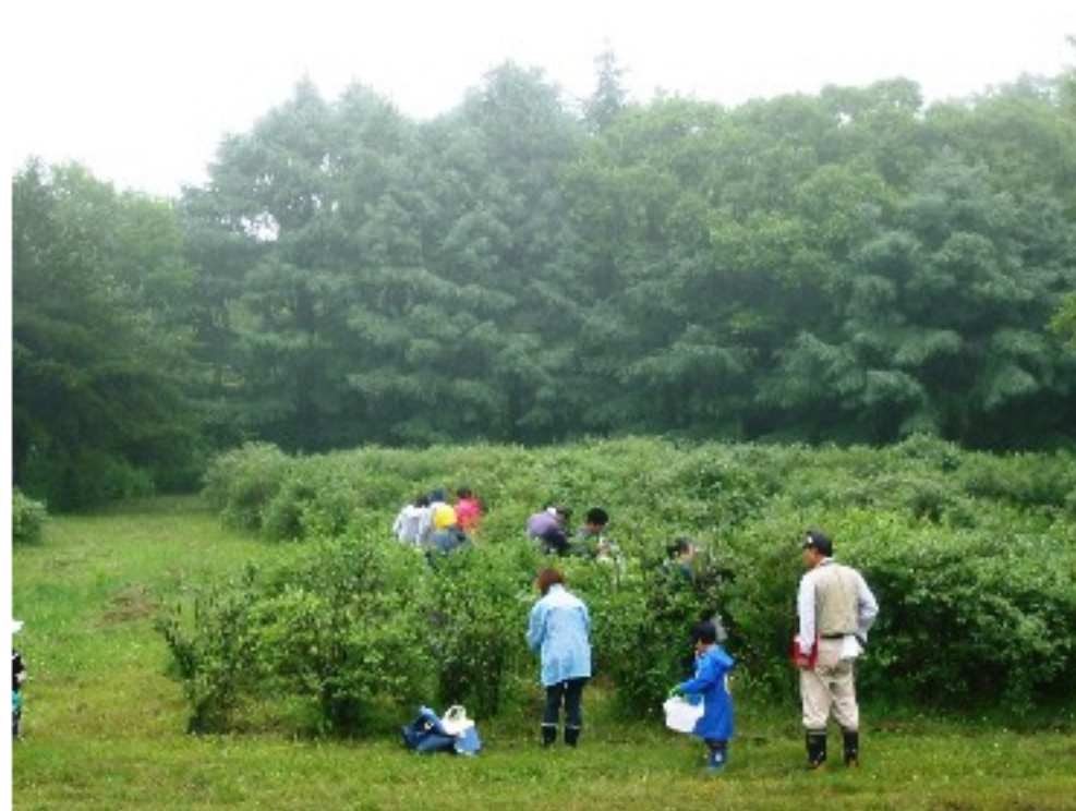
ハスカップ狩りの様子①