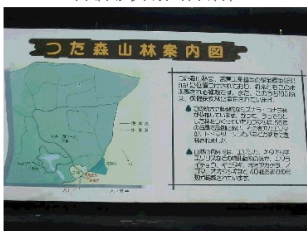
「つた森山林」の紹介 (拡大図へ)