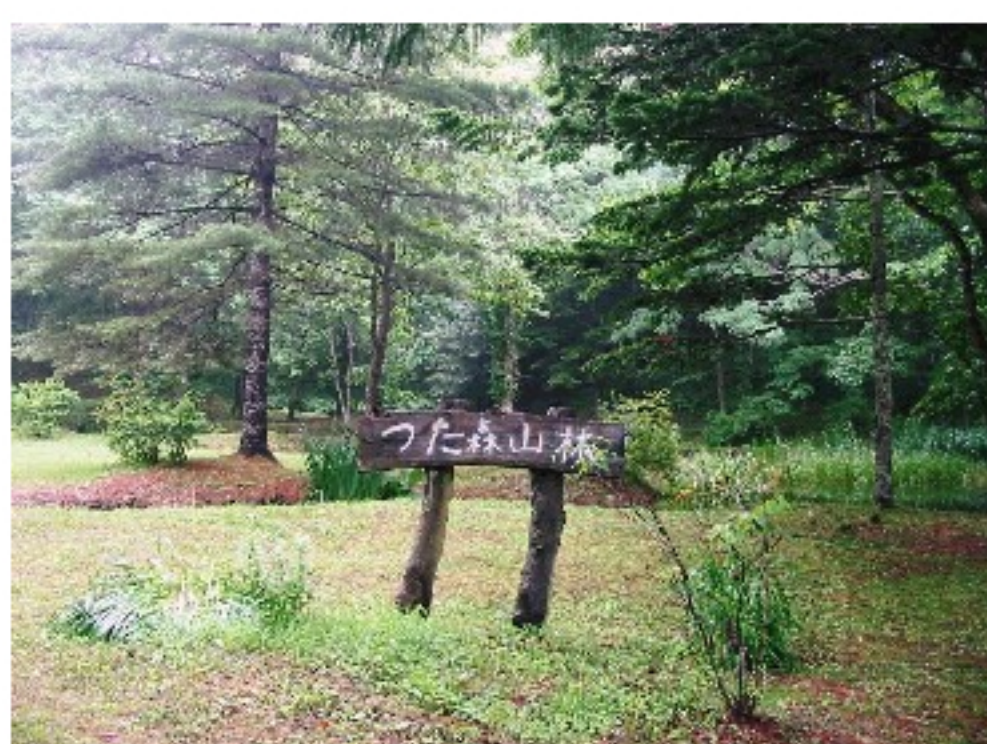
ハスカップ狩り 本当に楽しかったですね。