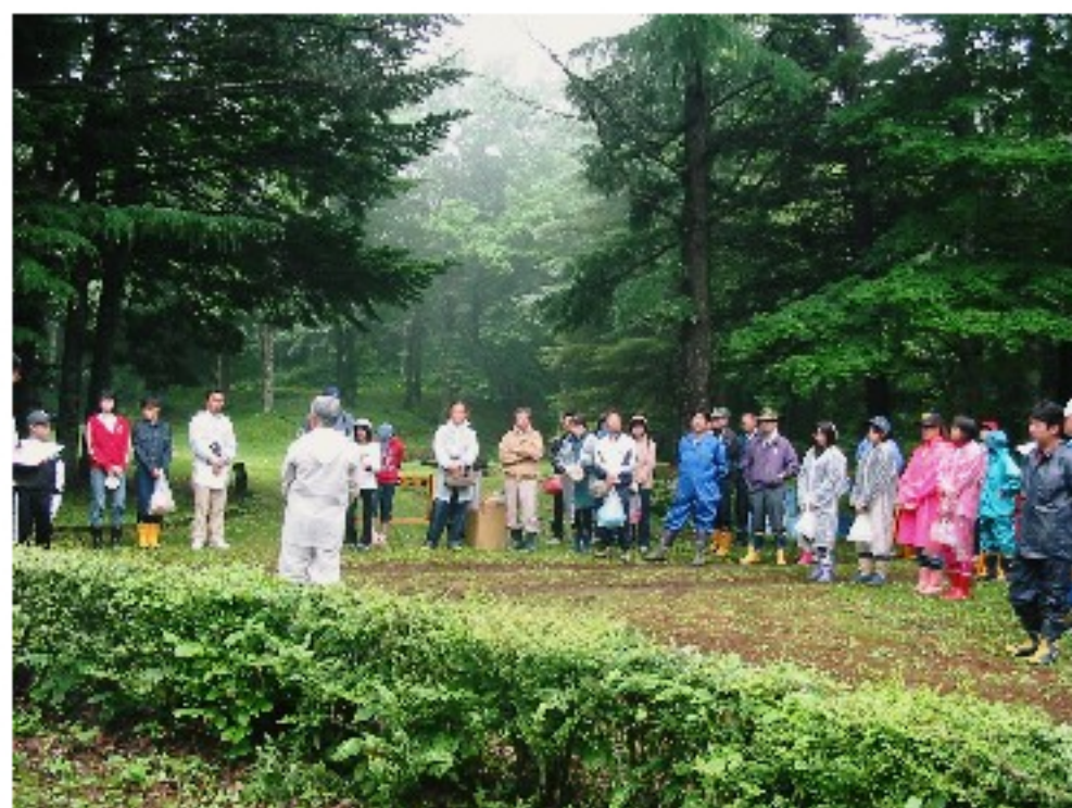
(株)苫東続木社長の挨拶によりスタート