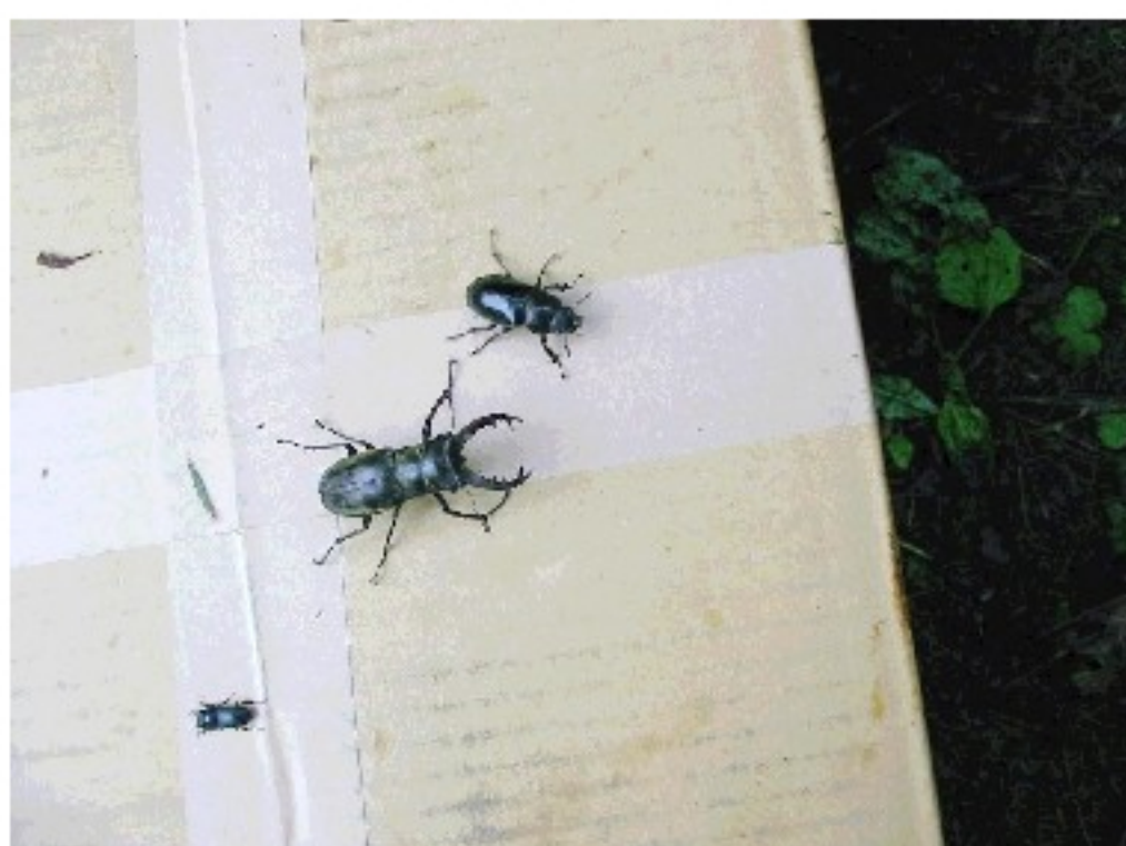
(運悪く捕獲された)クワガタ達～ミヤマクワガタのオス・メス、スジクワガタのメス(?)