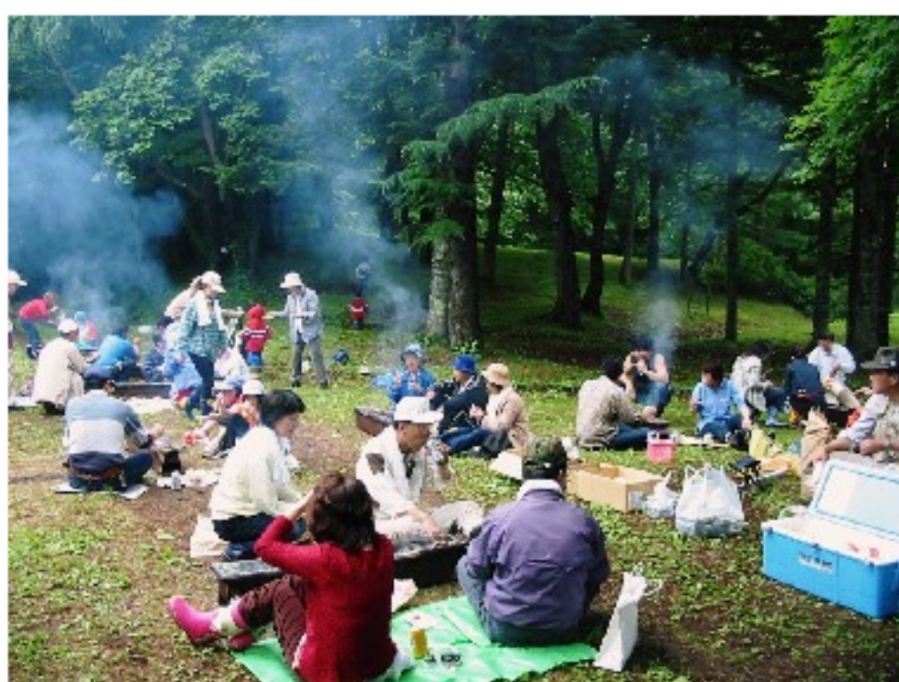
たくさんの野鳥の声を聞きながら緑の中で食べるジンギスカンは格別でした！