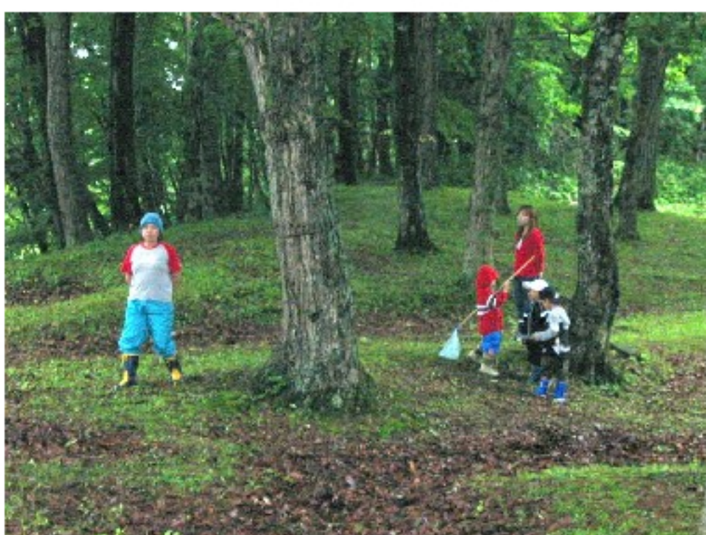
虫取りに励む子供たち