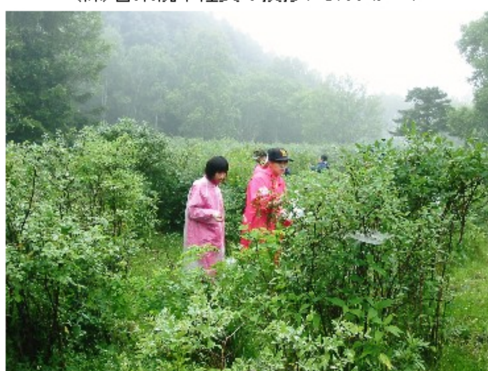
ハスカップ狩りの様子②